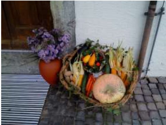
Korb am Eingang der Kirche.

Essen und Trinken, das Zusammensein in Tischgemeinschaft kommt sehr häufig in der Bibel vor. Besonders Jesus ist immer wieder beim Essen anzutreffen. Oft lud er sich gleich selber ein oder klopfte mitsamt seiner Jüngerschar an.